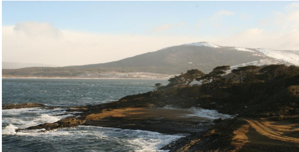
Vista a Bahía San Juan desde Fuerte Bulnes

Excursión de medio día que dura 5 hrs app. Donde conoceremos in situ acerca de la Historia regional. Podremos disfrutar fotografiando u observando la Flora y fauna Regional. Combinable perfectamente con cualquiera de nuestras otras 2 excursiones de medio día ofrecidas desde Punta Arenas.